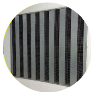
Ensaio LAIC 8-201/06 Atenuação em função da Profundidade (P) e Frequência do ruído (HZ)